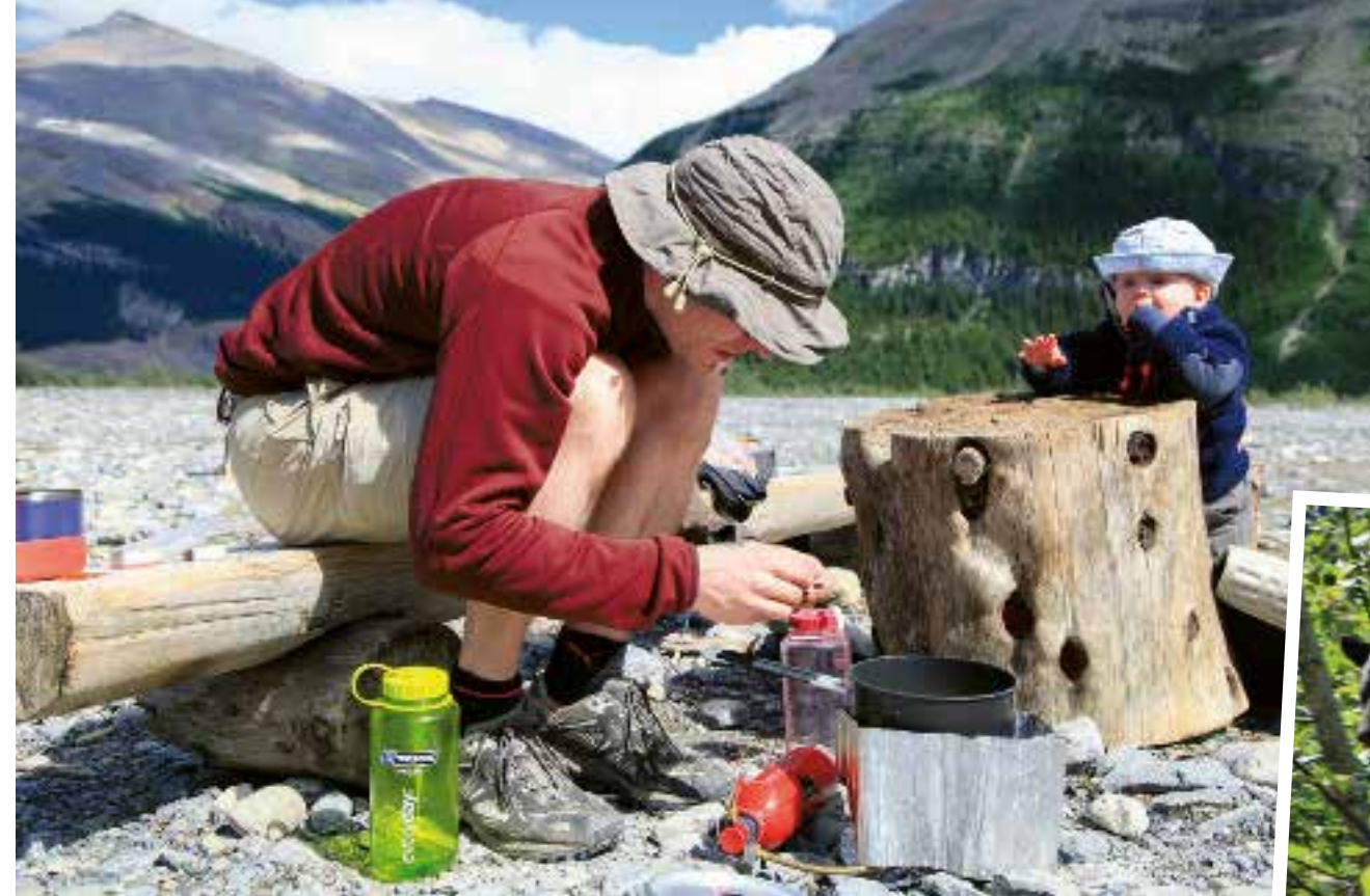
Vader en zoon zorgen voor een late lunch aan het Berg Lake.