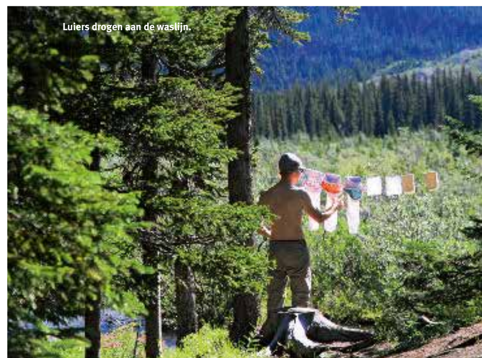
Luiers drogen aan de waslijn.

Wil je ook met kleine kinderen de bergen in, maar ben je onzeker over de mogelijkheden? De NKVB organiseert een workshop Bergwandelen met kinderen van 2-7 jaar. Kijk voor meer informatie op bergsportreizen.nl en klik op gezinsprogramma. Of bestel de brochure Van bengel tot berggeit via nkvbwebshop.nl .