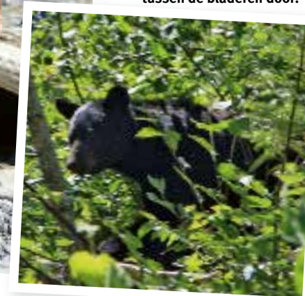
Een beer steekt zijn kop tussen de bladeren door.

Dat betekent na elke vieze broek de luier zo snel mogelijk uitspoelen en maar duimen dat hij op tijd droog is voor het volgende gebruik. Klungelig spoelen we ze uit boven een hoop stenen, want het water uit de rivier mogen we alleen gebruiken om te drinken. We behangen onze rugzakken met de natte luiers, die overdag snel drogen in de zon.